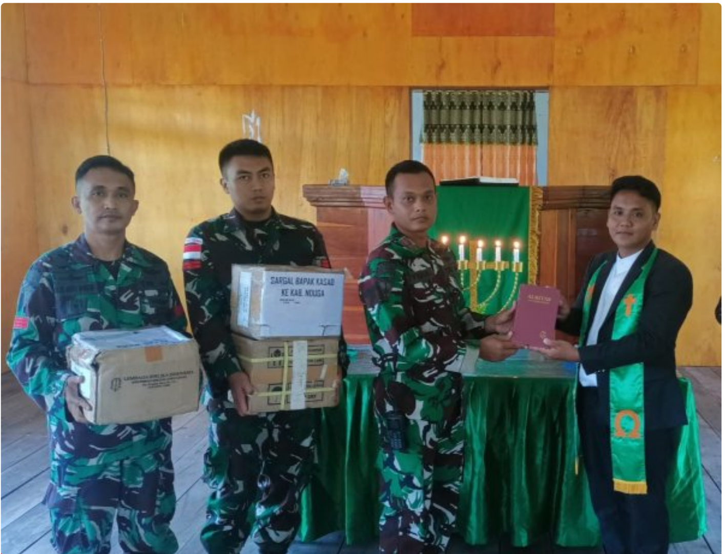
Foto: Satgas Yonif 503/Mayangkara kembali menunjukkan dedikasinya kepada masyarakat di Papua dengan memberikan dukungan alat musik untuk kegiatan ibadah di Gereja GKI Bethesda Batas Batu, Distrik Krepkuri, Kabupaten Nduga. Pada Minggu, 12 Januari 2025.