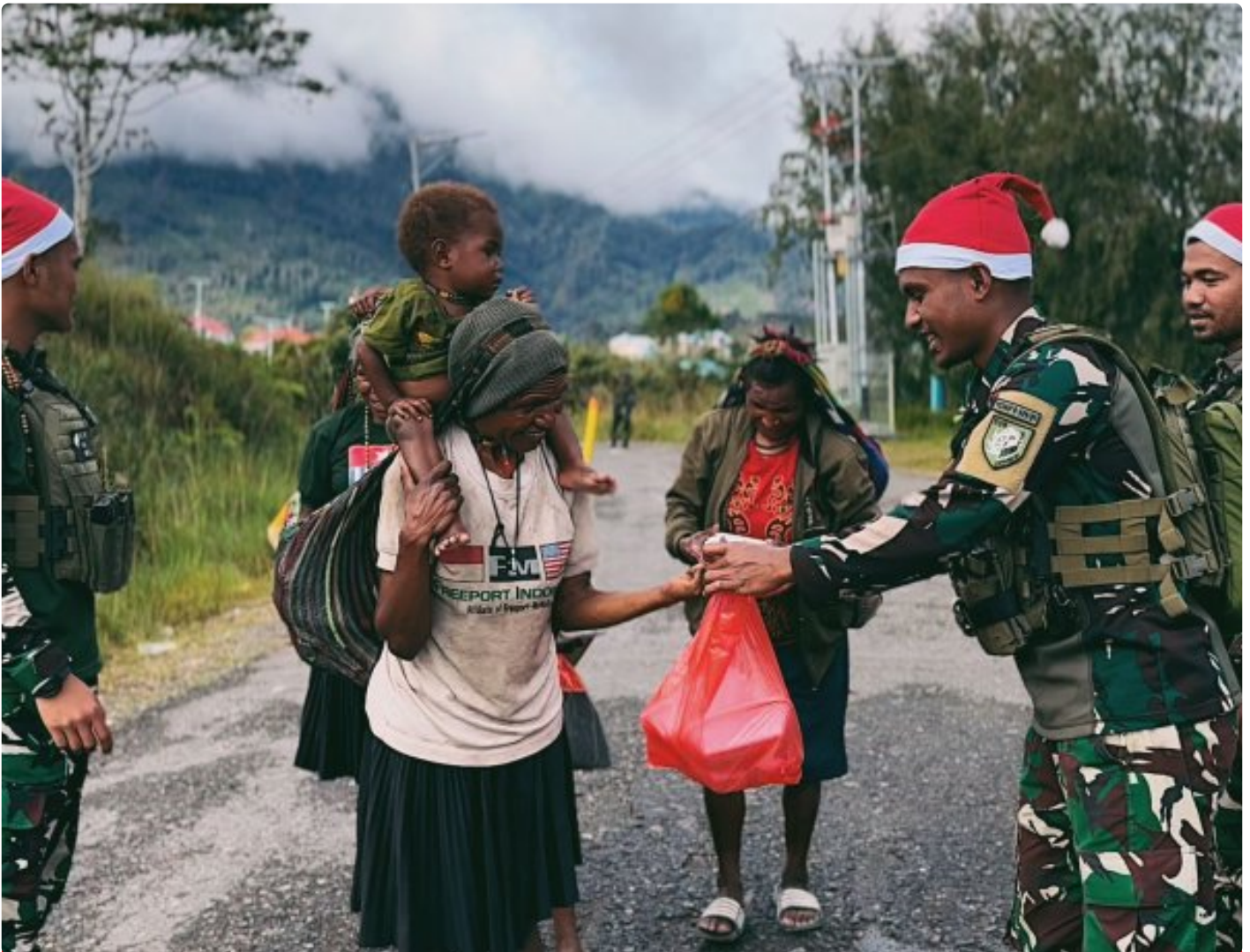
Foto: Satgas Yonif 509 Kostrad memberikan makna baru pada patroli keamanan dengan berbagi kebahagiaan bersama masyarakat di Intan Jaya, Papua.

PAPUA- Dalam balutan semangat Natal yang damai, Satgas Yonif 509 Kostrad